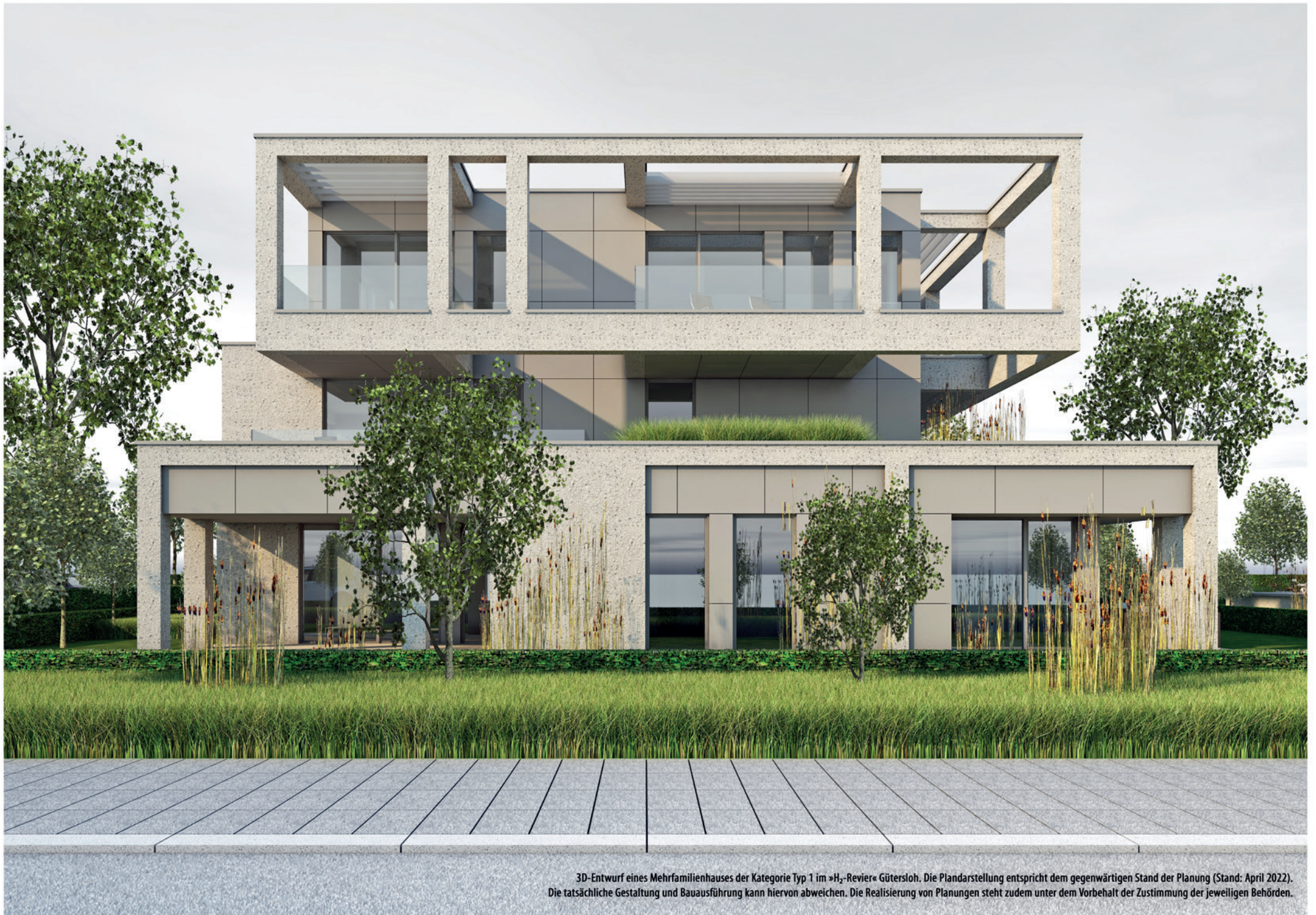
3D-Entwurf eines Mehrfamilienhauses der Kategorie Typ 1 im »H 2 -Revier« Gütersloh. Die Plandarstellung entspricht dem gegenwärtigen Stand der Planung (Stand: April 2022). Die tatsächliche Gestaltung und Bauausführung kann hiervon abweichen. Die Realisierung von Planungen steht zudem unter dem Vorbehalt der Zustimmung der jeweiligen Behörden.